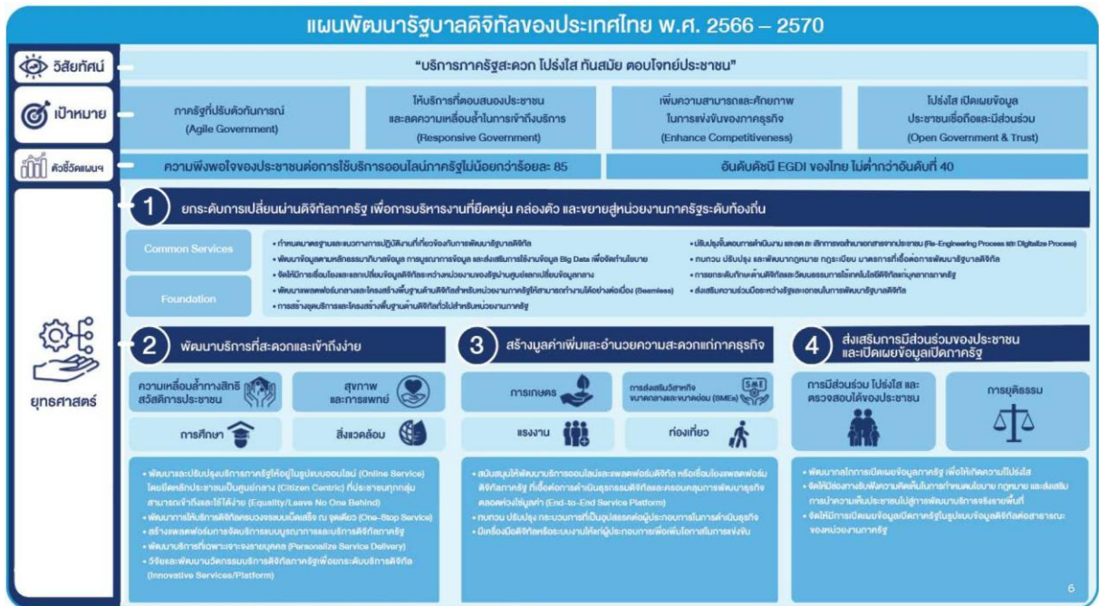
ภาพแผนพัฒนารัฐบาลดิจิทัลของประเทศไทย พ.ศ. ๒๕๖๖ – ๒๕๗๐