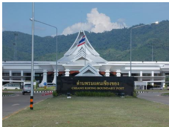
ประตูใหม่สู่อินโดจีน