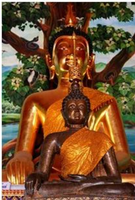
คำขวัญอำเภอเชียงของ