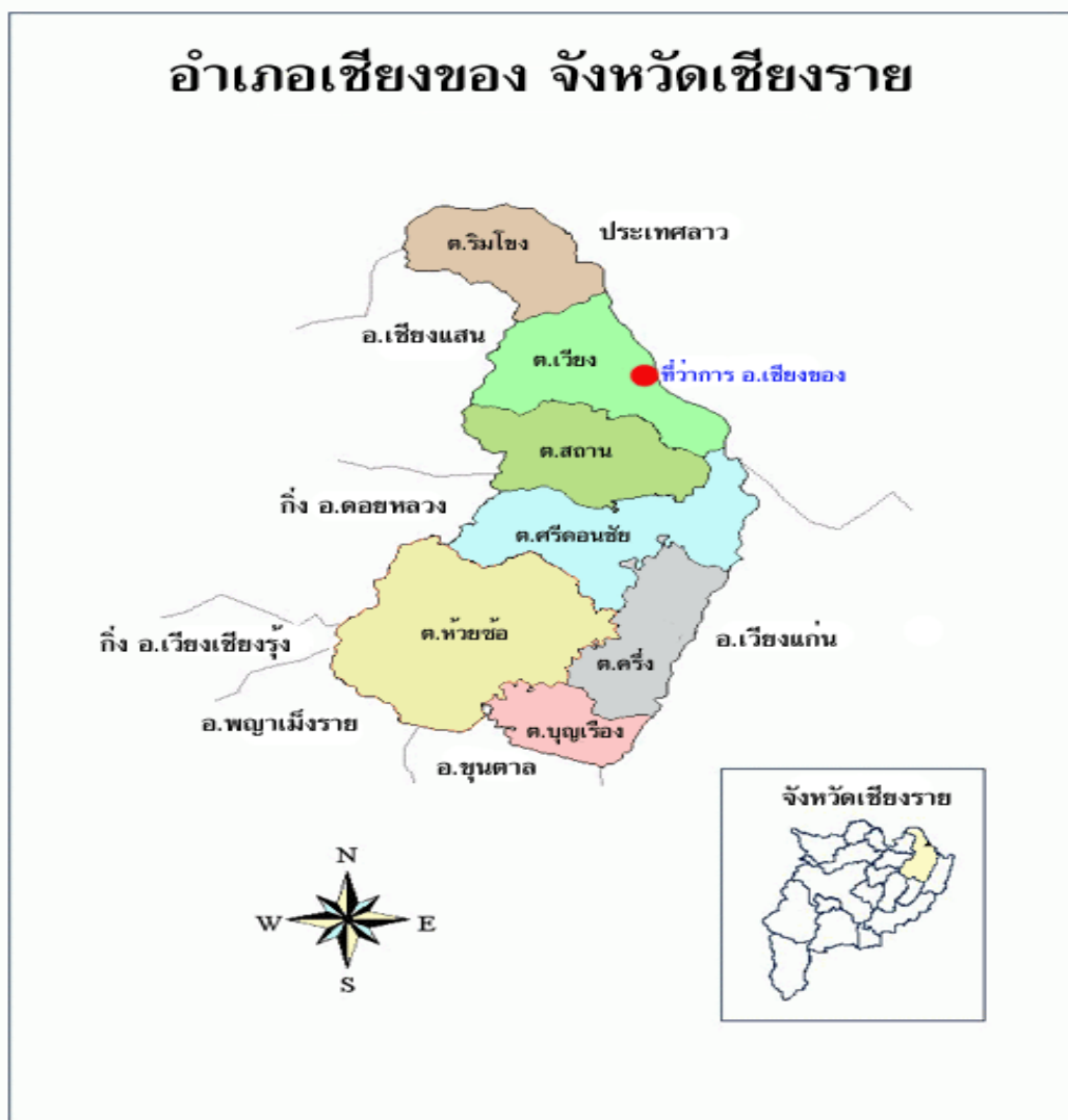
ภาพที่ ๑ แผนที่อำเภอเชียงของ