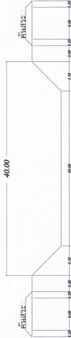
แบบแสดงรูปตัด A-A SCALE NO SCALE