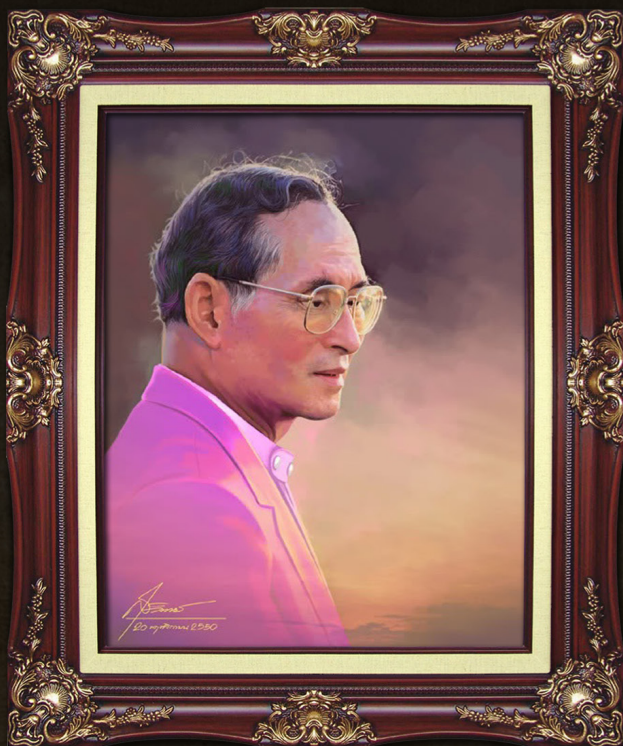
ศิลปิน : สุวิทย์ ใจป้อม

“...การที่จะทำงานเพื่อความมั่นคงและก้าวหน้า มิใช่จะกั๊กหน้ากั๊กตาทำหน้าที่ของแต่ละคนเท่านั้น จะต้องมีความร่วมมือสัมพันธ์กันระหว่างหน่วยงานทุกหน่วย เพื่อให้งานรุดหน้าไปพร้อมเพรียงกัน...”