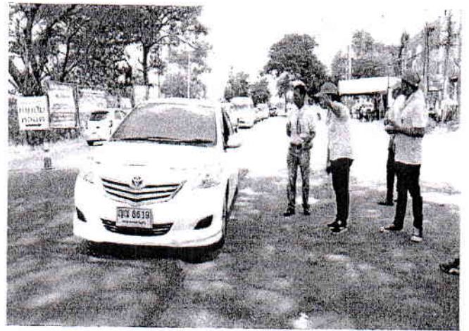
กำลังพลจิตอาสาเข้ามามีส่วนร่วมในการป้องกันและลดอุบัติเหตุทางถนนช่วงสงกรานต์