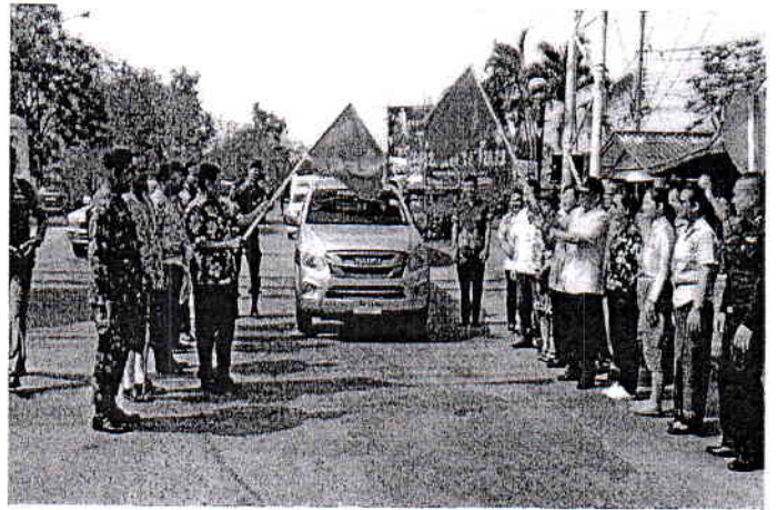
พิธีเปิดศูนย์อุบัติเหตุทางถนนช่วงเทศกาลสงกรานต์