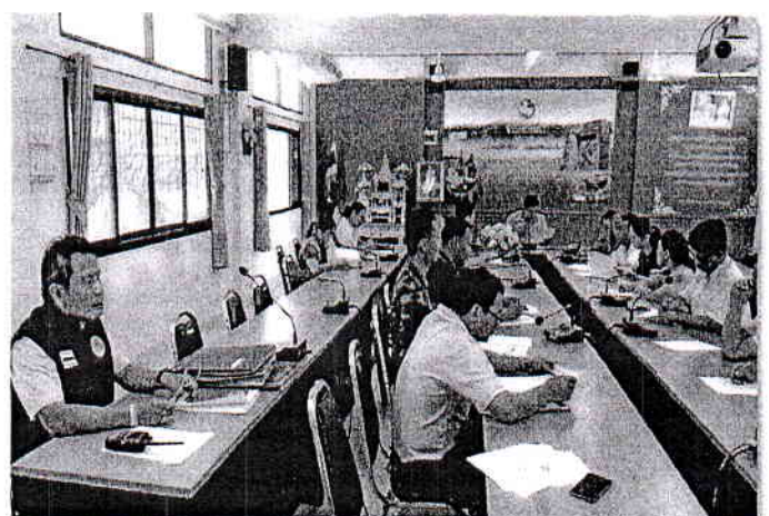
การประชุมของคณะกรรมการศูนย์ปฏิบัติการร่วมป้องกันอุบัติเหตุทางถนนช่วงเทศกาลสงกรานต์