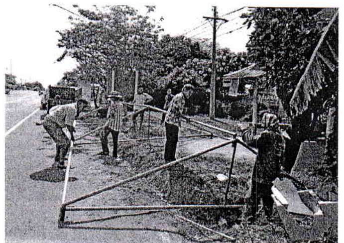
การดำเนินการจัดตั้งด่านชุมชนในพื้นที่ตำบล/หมู่บ้าน