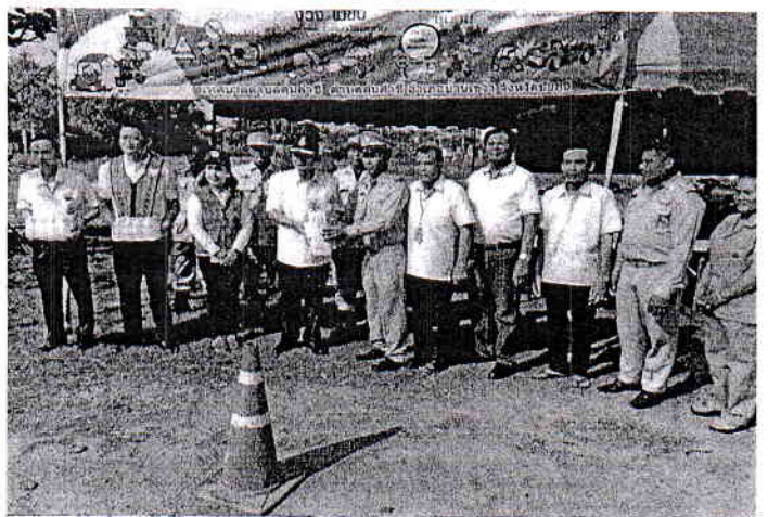
การตรวจเยี่ยมของผู้ว่าราชการจังหวัดชัยภูมิ และรองผู้ว่าราชการจังหวัดชัยภูมิ