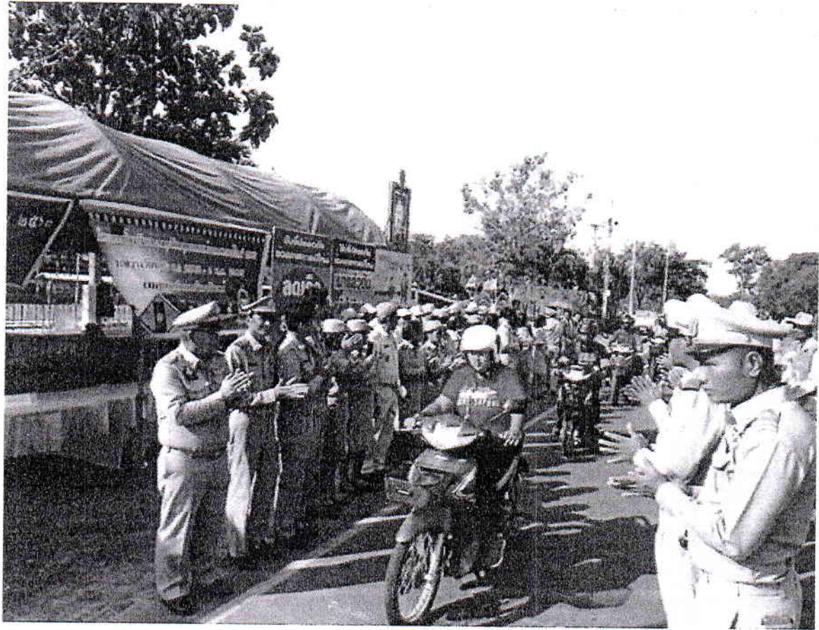
ภาพถ่ายการปฏิบัติการร่วมป้องกันและลดอุบัติเหตุทางถนน ช่วงเทศกาล อำเภอเมืองจันทร์ จังหวัดศรีสะเกษ