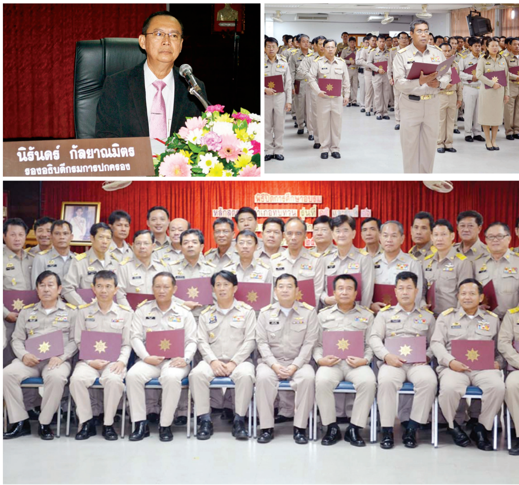
๒) หลักสูตรปilotอำเภอ จำนวน ๔ รุ่นๆ ละ ๖ สัปดาห์ รวม ๒๓๑ คน